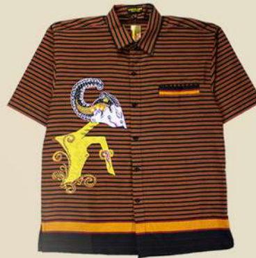
Kemeja Pendek Lukis Wayang IDR 300.000,-