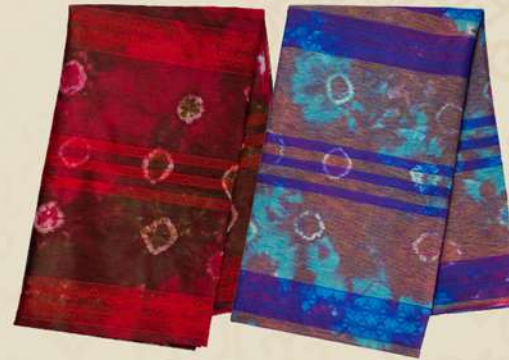
Dobby Jumputan IDR 200.000,-