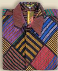
Kemeja Pendek Patchwork IDR 550.000,-