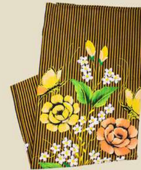
Lurik Lukis Bunga IDR 175.000,-