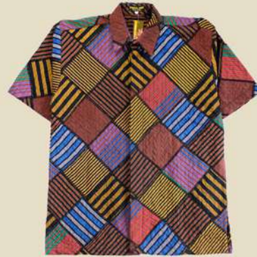
Kemeja Pendek Patchwork IDR 550.000,-