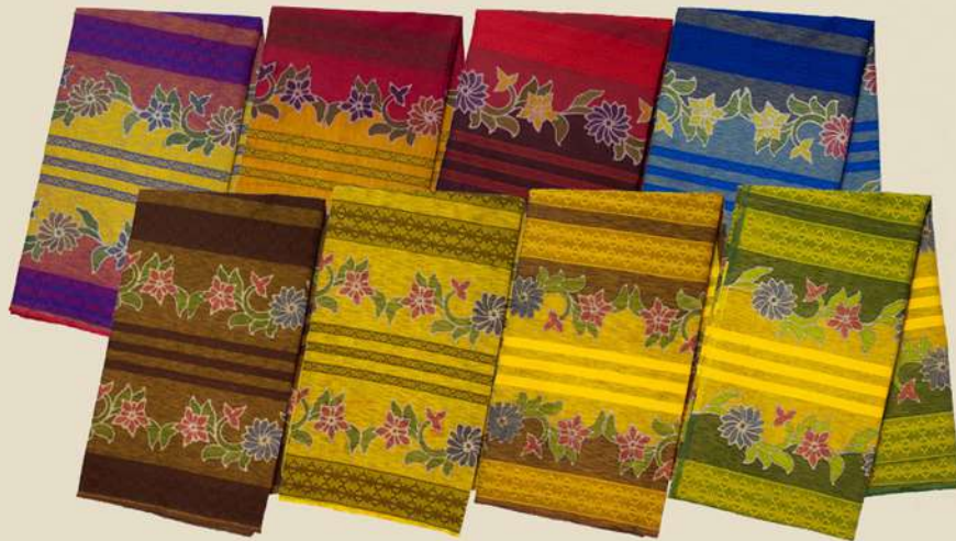
Dobby Tulis Bunga IDR 225.000,-