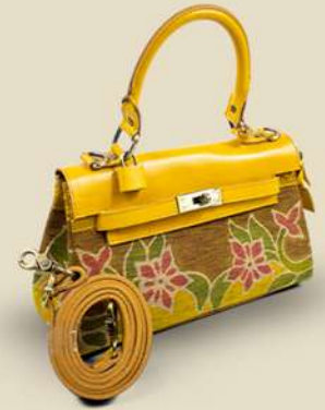
Hermes IDR 395.000,-