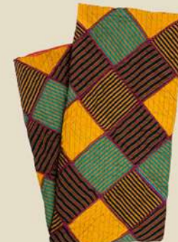
Patchwerk Lurik IDR 450.000,-