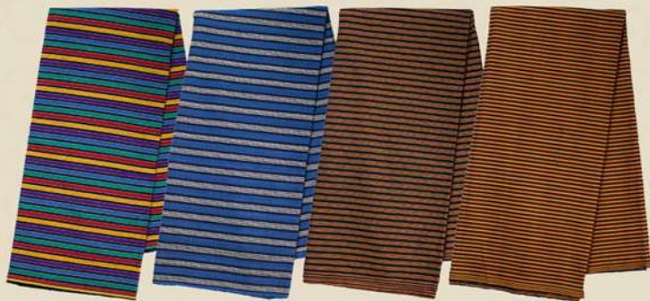
Lurik Katun Twist IDR 80.000,-