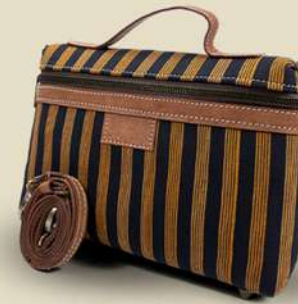
Pouch Lurik IDR 150.000,-