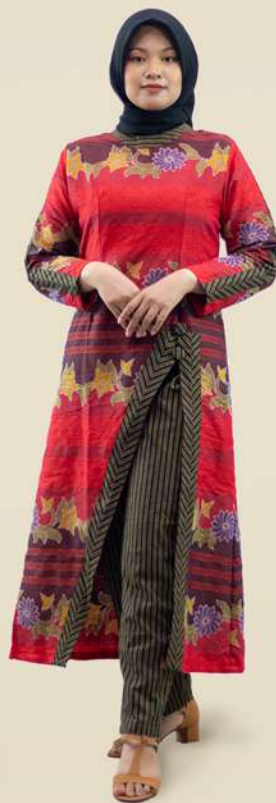
Stelan Tunic Long Cardy