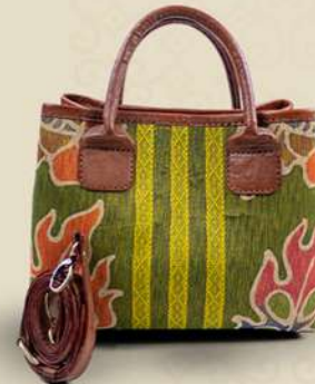
WB Dobby IDR 225.000,-