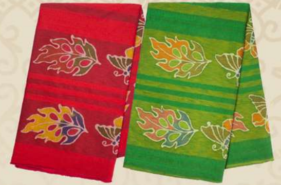
Dobby Daun dan Kupu IDR 225.000,-