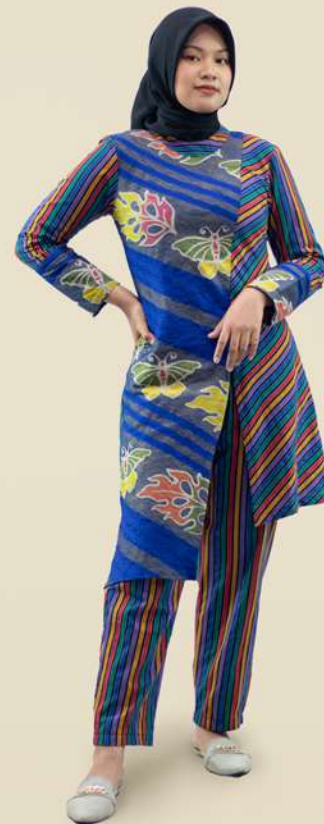
Stelan Tunic Doby Serong