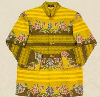
Beskap Doby IDR 1.400.000,-