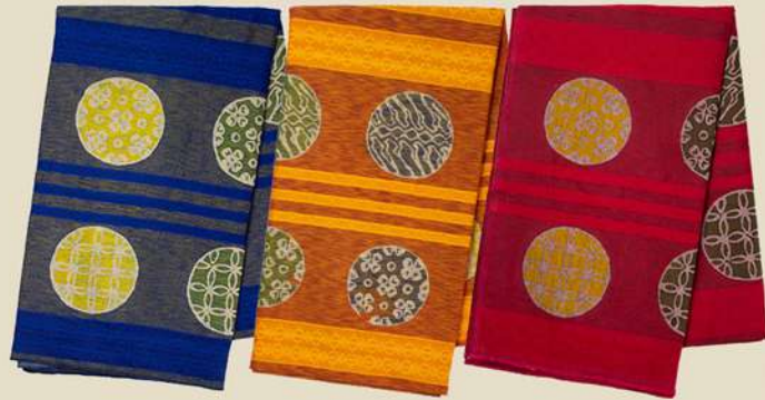
Dobby Tulis Bulat IDR 225.000,-