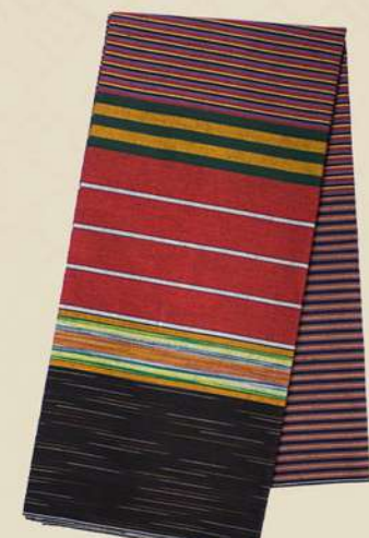
Lurik 4 Dimensi IDR 150.000,-