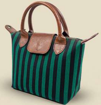
WB Lurik IDR 185.000,-