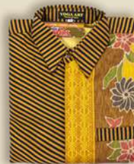
Kemeja Pendek Dobby & Lurik IDR 350.000,-