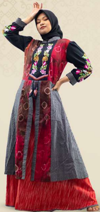
Dress Doby Rompi Bordir