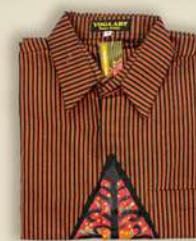
Kemeja Pendek Lukis Gunungan IDR 300.000,-