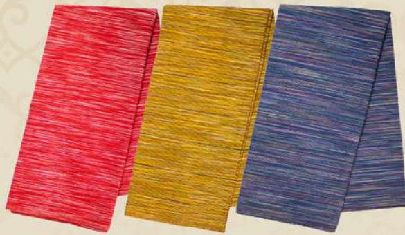
Lurik Hujan Deras IDR 100.000,-