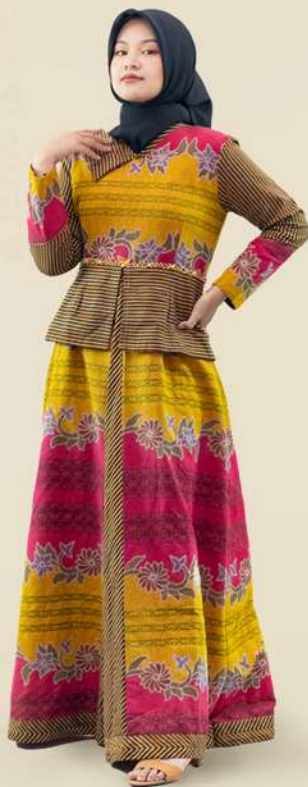
Gamis Doby Lembayung Payet