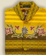
Beskap IDR 1.400.000,-