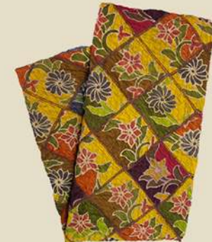
Patchwerk Dobby IDR 650.000,-