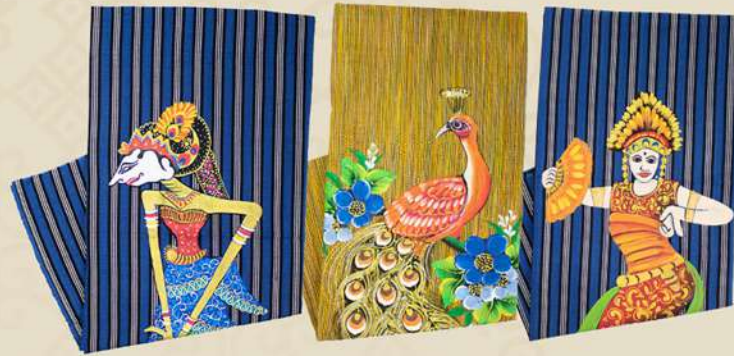
Lurik Lukis Wayang, Merak, Tari IDR 200.000,-