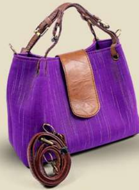
Long Camp IDR 185.000,-