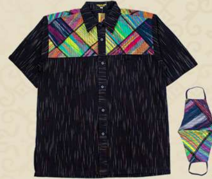
Kemeja Pendek Patchwork & Lurik IDR 350.000,-