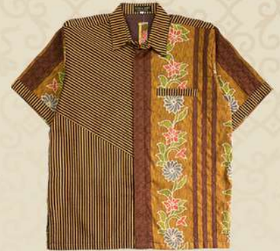
Kemeja Pendek Dobby & Lurik IDR 350.000,-