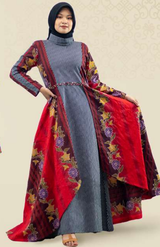
Dress Doby Layer Payet