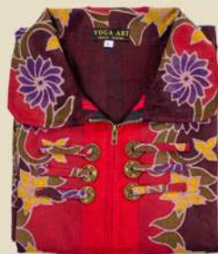
Tunic Doby Payung Bordir