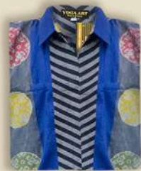
Kemeja Pendek Dobby & Lurik IDR 350.000,-