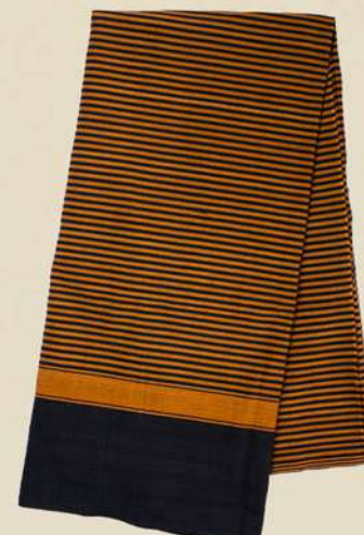
Lurik Tumpal Sebelah IDR 100.000,-