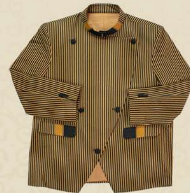
Beskap Lurik IDR 1.100.000,-