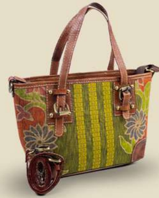
Fossil Dobby IDR 225.000,-