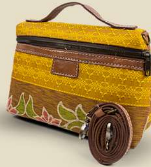
Pouch Doby IDR 185.000,-