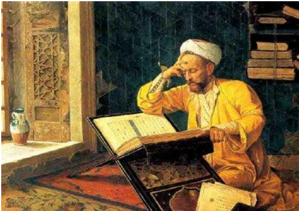
Syekh Hamzah al-Fansuri ulama besar Indonesia

Masalah penyaksian Tuhan ini berkaitan dengan rukun Islam pertama, yakni mengucapkan dua kalimah syahadat: Asyhadu an lā ilāha illā Allāh . Artinya, ‘Aku bersaksi bahwa tidak ada Tuhan kecuali (Tuhan yang nama-Nya) Allah’; wa asyhadu anna Muhammadan Rasūlullāh . Artinya, ‘Dan aku bersaksi bahwa Nabi Muhammad itu Rasulullah (utusan Allah)’. Teks dua kalimah syahadat ini sudah baku, tidak bisa dan tidak boleh diubah-ubah. Tidak boleh diubah dengan teks kalimat berikut, misalnya: Aku “mendengar” bahwa tidak ada Tuhan kecuali (Tuhan yang nama-Nya) Allah; dan aku “mendengar” bahwa Nabi Muhammad itu Rasulullah. Teks kalimah syahadat itu menggunakan kata “bersaksi”, tidak “mendengar”. Apakah Anda setuju dengan pendapat Ibn Arabi? Bagaimana pendapat Anda?