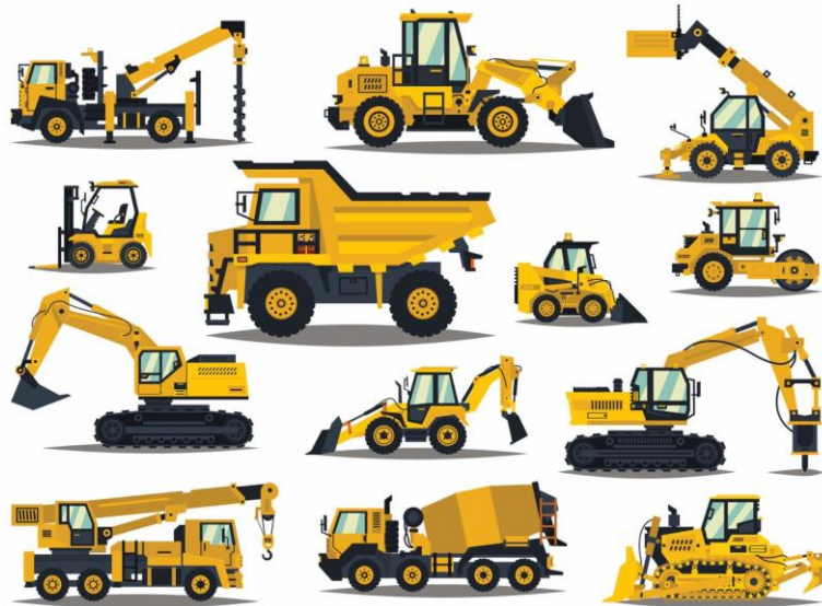
Menghitung kebutuhan alat