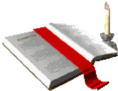
ALKITAB DASAR OBYEKTIF